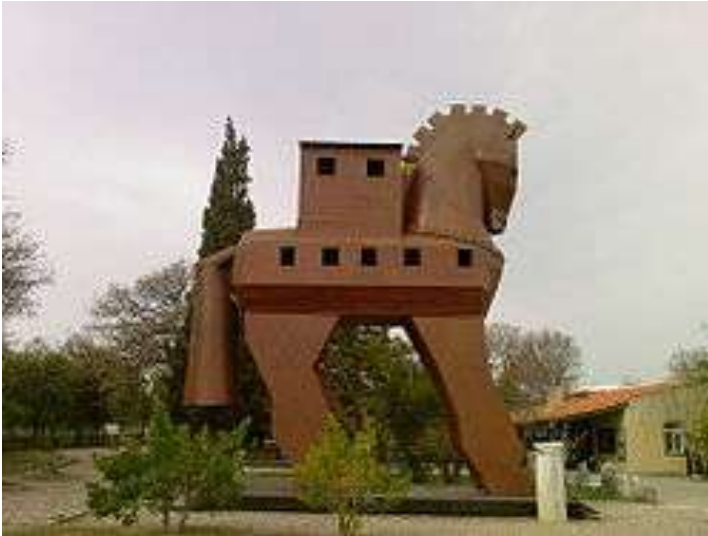
Truva Antik Kenti Girişi – Hisarlık, Çanakkale

Deklaranın aklına Truva Atı geldi o anda ve yerden ♠ oynayıp ♠A koydu. Batıdan ♠K düşmedi.