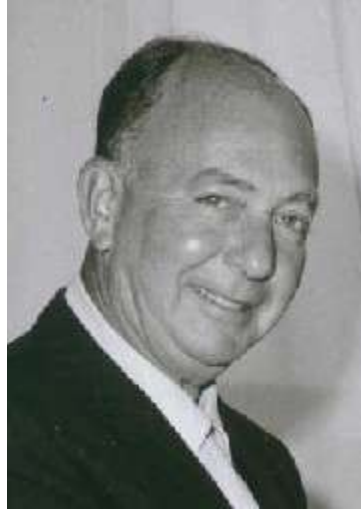
Howard Schenken (1904-1979)